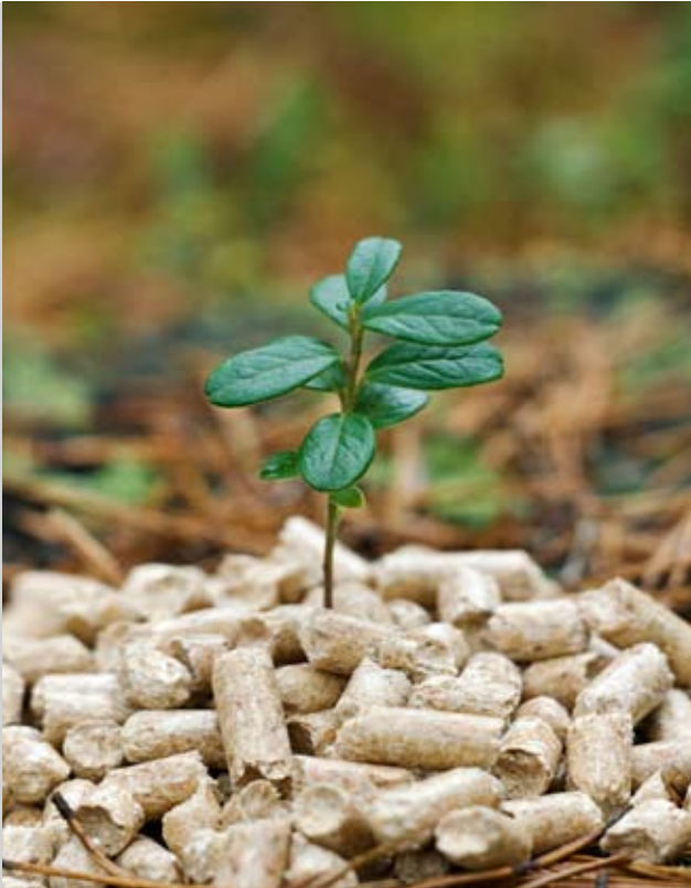
Umweltbewusst: Immer mehr Haushalte heizen mit Holzpellets

A ngesichts steigender Preise für fossile Energieträger wie Öl und Gas ziehen immer mehr Verbraucher den Umstieg auf erneuerbare Energien in Betracht. Doch nicht nur die Kosten spielen eine Rolle – auch Umwelt- und Klimaschutz gewinnen zunehmend an Bedeutung.