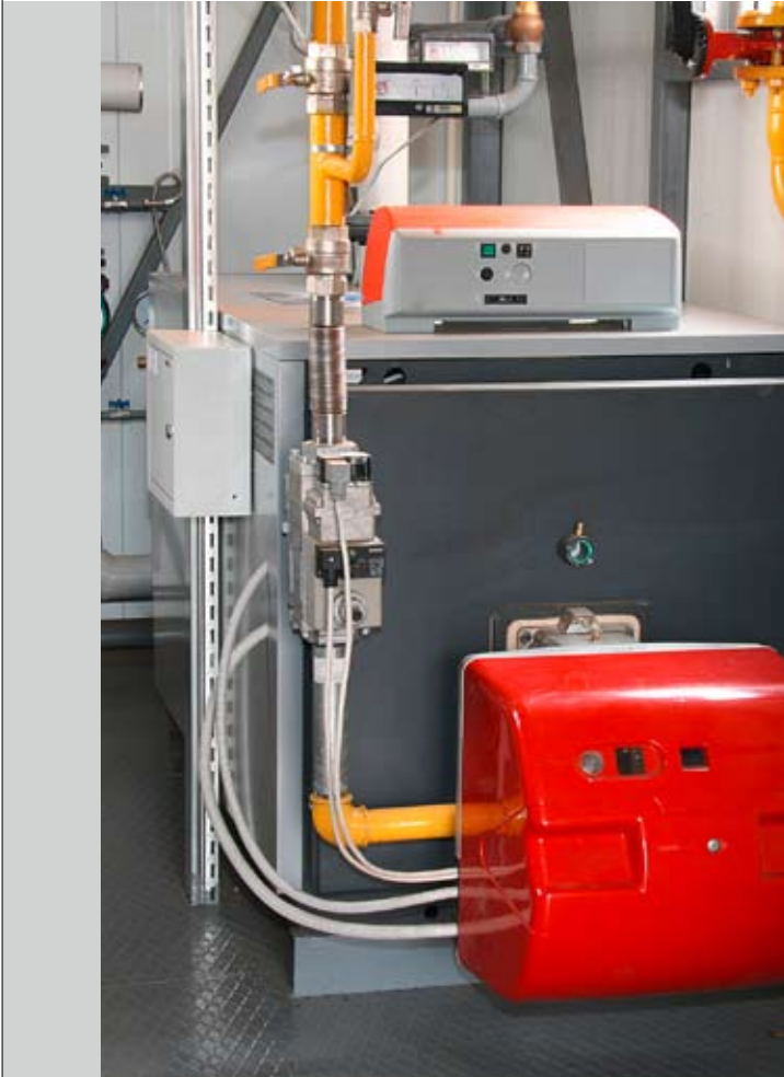
Moderne Technik: Heizanlagen werden immer effizienter