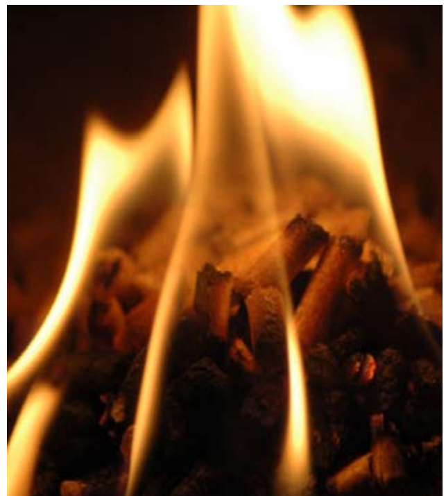
Sauber: Pellets verbrennen CO 2 -neutral und fast rückstandsfrei

Holzpellets haben dank ihrer hohen Energiedichte ein geringes Lagervolumen. Vollautomatische Heizungen mit Fördersystem sorgen für einen reibungslosen und stressfreien Verbrennungsprozess. Dabei hinterlassen die kleinen Energiebündel nur fünf bis zehn Gramm Asche pro Kilogramm.