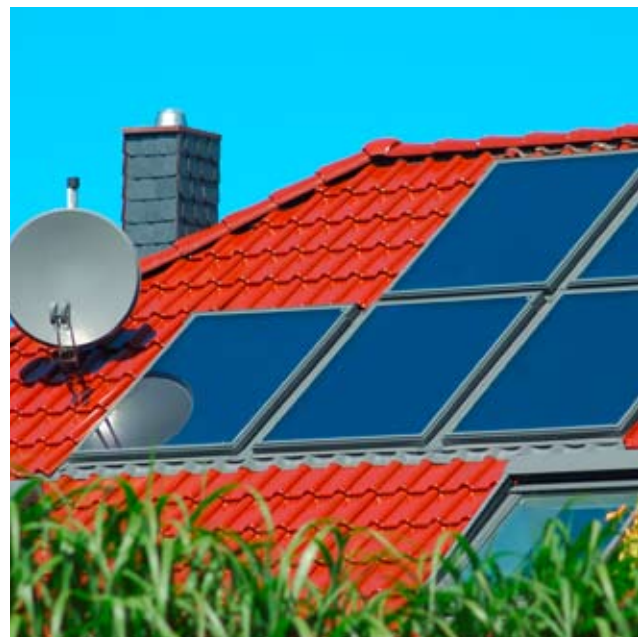
Sinnvoll: Solarkollektoren ergänzen andere Heizsysteme optimal